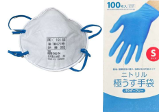
使い捨てマスクは、DS3 (FFP3, NP95等) やDS2 (FFP2, NP95等) などを使いましょう。ニトリル手袋は図書を汚さないようにパウダーフリー(粉なし)のものを使いましょう。

もしあなたの図書館に、ヒ素を含む本、あるいは、ヒ素を含むかもしれない本があったら、どうしたらよいでしょうか？まず、使い捨てのマスク、使い捨てのニトリル手袋(粉なし)等で自分自身をしっかりと防護して、その本を密封できる透明の袋に入れ、隔離しましょう。その本が置かれていた書架の棚板や、隣接していた本の表紙には、ヒ素を含む表紙から出た埃が付着しているかもしれないので、ペーパータオルなどでそれらを拭きましょう。使用したペーパータオルは、使い捨てマスク、使い捨てニトリル手袋と一緒にゴミ袋に入れて密封し、有害物質として処理しましょう。隔離した本は、ヒ素を含む(あるいはそれがある)ことを明記したうえで鍵のかかるキャビネット等に入れて、その鍵もきちんと管理しましょう。また、隔離した本の代替物として、デジタルアーカイブのURLや、複製本された同一の本を収蔵する図書館を探して、利用者から請求があった際に提供できるようにしておきましょう。