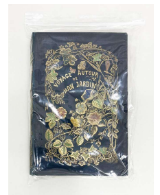
透明の袋に密封されたヒ素を含む本