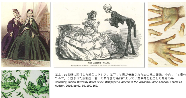
左上：19世紀に流行した緑色のドレス、左下：ヒ素が検出された19世紀の壁紙、中央：「ヒ素のワルツ」を題された風刺画、右：ヒ素を含む染料によってヒ素中毒を起した患者の手 Hawksley, Lucinda, Bitten By Witch Fever: Wallpaper & Arsenic in the Victorian Home , London: Thames & Hudson, 2016, pp.62, 99, 100, 169.

ヒ素を含む天然鉱物性の色材は古代から使われていましたが、ヨーロッパでは18世紀末から19世紀はじめにかけてヒ素を含む鮮やかな明るい緑色の人工色材が発明され、欧米で大人気となりました。その人工色材の主成分は亜ヒ酸銅やアセト亜ヒ酸銅といった有毒なヒ素化合物でしたが、当初はその危険性が十分に認識されておらず、シェール・グリーン、エメラルド・グリーン、バリ・グリーン、シュヴァルツフルト・グリーン、ウィーン・グリーン等の名称で呼ばれ、もてはやされました。これらの人工色材は19世紀の欧米で、ドレス・壁紙・造花など様々な布製品・紙製品の着色に用いられ、多くのヒ素中毒患者を出しました 2 。そして、その美しくも危険な緑色の人工色材は、本の表紙にも使用されました。奇しくも19世紀は、工業化と奴隷制度に支えられて製紙と綿工業が急速な発展を遂げた時代であり、また、公立学校の設立によって安価な本の需要が高まった時代でもありました。一部の富裕層だけがお気に入りの製本職人にオーダーメイドで革装本を作らせる時代は終わり、初めから製本されているクロス装やペーパーバックの安価な本が大量に製造・販売される時代に入っていました 3 。欧米の図書館・博物館では、2023年9月25日時点で、既に134タイトルも19世紀の洋書がヒ素を含む本として確認されています 4 。