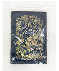
透明の袋に密封されたヒ素を含む本