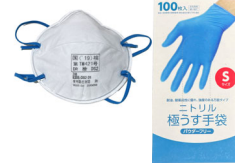
使い捨てマスクは、DS3 (FFP3, NP99等)やDS2 (FFP2, NP95等)などを使いましょう。ニトリル手袋は図書を汚さないようにパウダーフリー(粉無し)のものを使いましょう。

もしあなたの図書館に、ヒ素を含む本、あるいは、ヒ素を含むかもしれない本があったら、どうしたらよいでしょうか？まず、使い捨てのマスク、使い捨てのニトリル手袋(粉なし)等で自分自身をしっかりと防護して、その本を密封できる透明の袋に入れ、隔離しましょう。その本が置かれていた書架の棚板や、隣接していた本の表紙には、ヒ素を含む表紙から出た埃が付着しているかもしれませんので、ペーパータオルなどでそれらを拭きましょう。使用したペーパータオルは、使い捨てマスク、使い捨てニトリル手袋などと一緒にゴミ袋に入れて密封し、有害物質として処理しましょう。隔離した本は、ヒ素を含む(あるいはそのおそれがある)ことを明記したうえで鍵のかかるキャビネット等に入れて、その鍵もきちんと管理しましょう。また、隔離した本の代替物として、デジタルアーカイブのURLや、複製本された同一の本を収蔵する図書館を探して、利用者から請求があった際に提供できるようにしておきましょう。