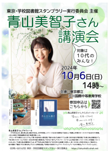
作家講演会ポスター